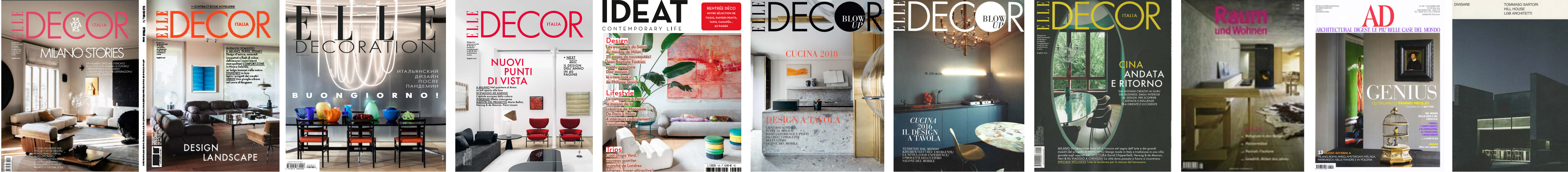
Antonella Barberis / tesi / 2018-19 / Interior Design 2 Magnifiche Presenze