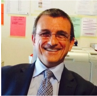
ARCH. LUIGI CARRETTA

Studio: Via Lampugnano, 105 – 20151 Milano – Tel. 02.33.49.60.95 e-mail archimia@archimia.it luigi.carretta@archimia.it posta elettronica certificata: carretta.4719@oamilano.it sito internet www.archimia.it